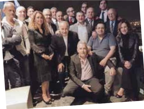
Adembenemend uitzicht in Milaan: onze Italiaanse vestiging organiseerde een galadiner op de 20e verdieping van de WJC toren.