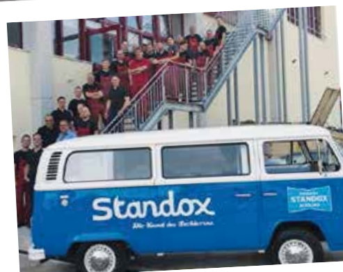
De Zwitserse importeur André Koch AG bouwde een iconische T2b om tot een mobiele cateringdienst en verraste daarmee zijn klanten.