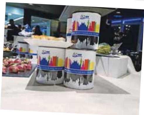
Ons motto in Italië: Standox brengt kleur in de wereld.

Stelt u zich even voor dat u verantwoordelijk bent voor een groot automerk en mee kunt beslissen hoe dat merk naar buiten moet treden, wat de namen van de nieuwe auto's worden, soms ook hoe ze eruit moeten zien en welke kenmerken ze moeten hebben. Dat is vergelijkbaar met de rol van de Standox Brand Manager. Voor mij, als een marketing- en reclame-expert, is dat een prachtige en boeiende job. Wie wil er nu niet zo'n vooruitstrevend merk beheren en beslissen hoe mijn regio Standox in de toekomst te zien krijgt? Jaarlijks ontvangen het Standox-team en ik heel wat bezoekers uit het buitenland. De gesprekken en discussies met deze gasten zijn zeer interessant en informatief, en we blijven heel wat opsteken over nieuwe aspecten van de markten waarin we actief zijn. En bovenop dat alles, is het een eer om een merk als Standox verder te ontwikkelen, maar ook te behouden. Een merk dat door ons moederbedrijf, Axalta, bovendien zeer gewaardeerd wordt. Ik hoop dat ik deze rol ook nog de komende jaren zal mogen blijven spelen.