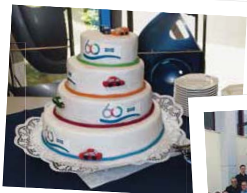
Een verjaardagstaart voor 60 jaar: Standox werd ook gevierd tijdens de internationale marketing workshop in Wuppertal.