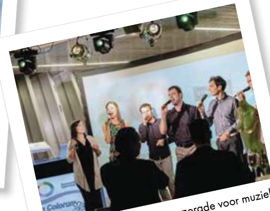
De a-cappellagroep Kreativo zorgde voor muziek in Slovenië.