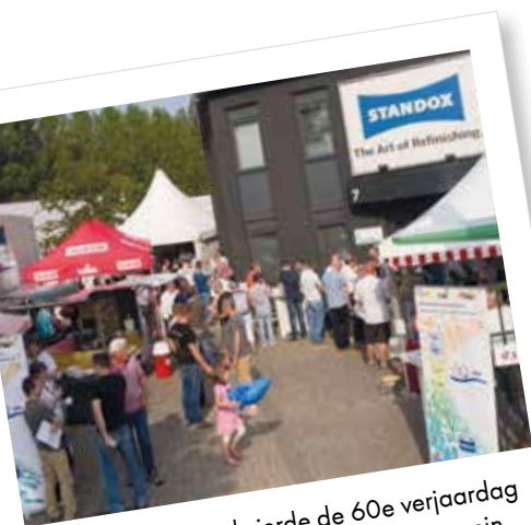
Standox Nederland vierde de 60e verjaardag tijdens het Standox Spektakel in Nieuwegein.

wolkenkrabber het hoogtepunt van een tweedaags verjaardagsfeest. En de Slovenen hadden bovendien een bijkomende reden om feest te vieren: Forum Colorum, de invoerder van Standox, werd 25 dit jaar. Een greep uit de foto's van slechts enkele van de vele vieringen vorig jaar.