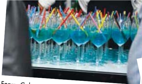
Forum Colorum, de Sloveense importeur was bijzonder creatief: de drankjes stemden overeen met de kleuren van de Standox-viering.